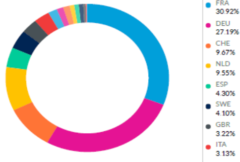
Repartition par zone géographique