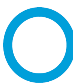
Repartition par classe d'actifs